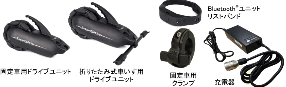
固定車用ドライブユニット