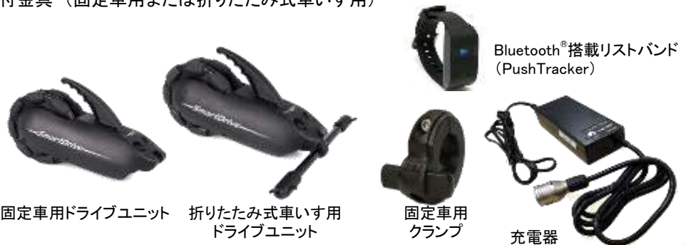
固定車用ドライブユニット